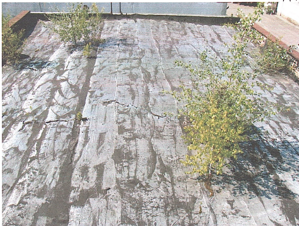
Фото № 19. Вигляд покрівлі споруди гаража (низька секція).