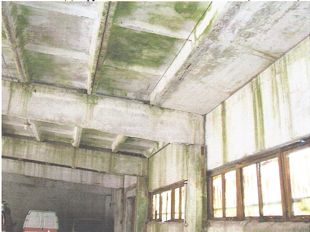
Фото № 14. Зволоження огорожувальних конструкцій (склад № 3).