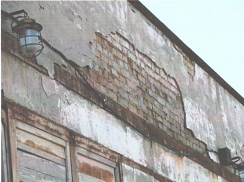
Фото № 11. Обвалення штукатурного шару парапетних стін (гараж).