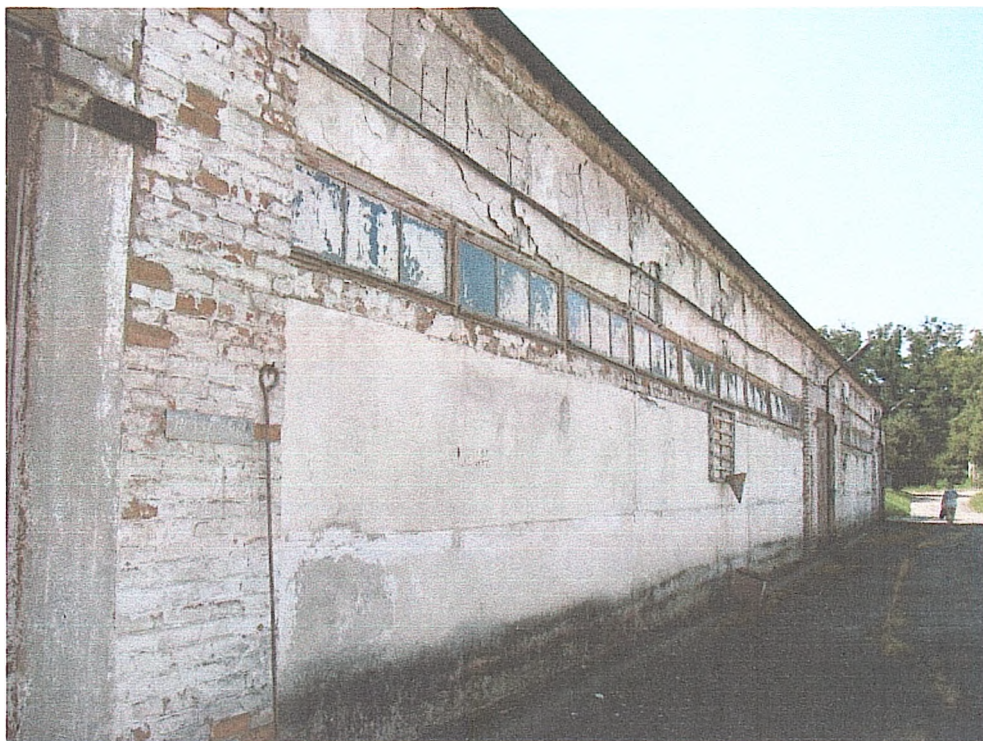
Фото № 3. Вигляд головного фасаду споруди складу № 1.