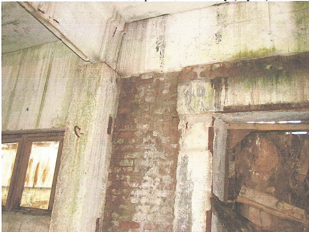
Фото № 16. Зволоження огорожувальних конструкцій, обвалення штукатурного шару та руйнування дерев'яної обшивки воріт (гараж).