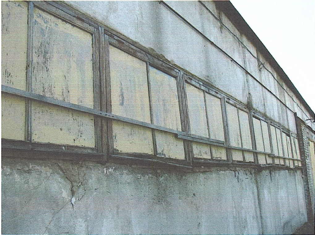
Фото № 9. Вигляд віконних блоків (склад № 3).