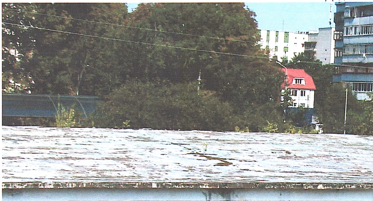
Фото № 17. Вигляд покрівлі споруди складу № 3.