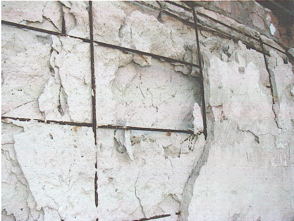
Фото № 13. Деструкція навісних стінових панелей (склад № 1).