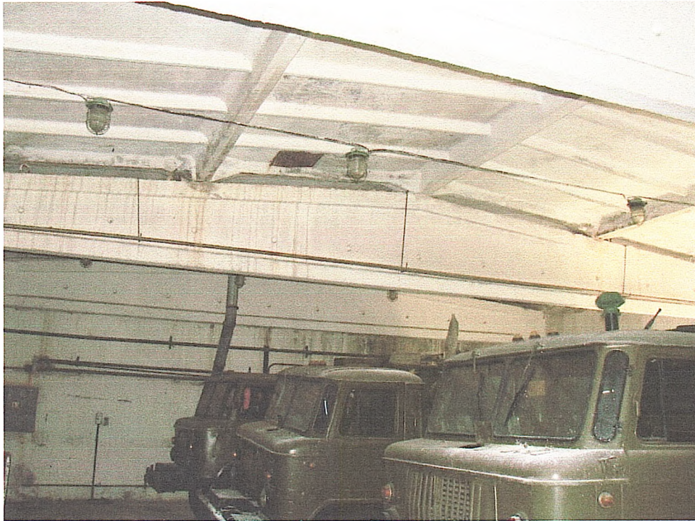
Фото № 15. Вигляд приміщення боксу (гараж).