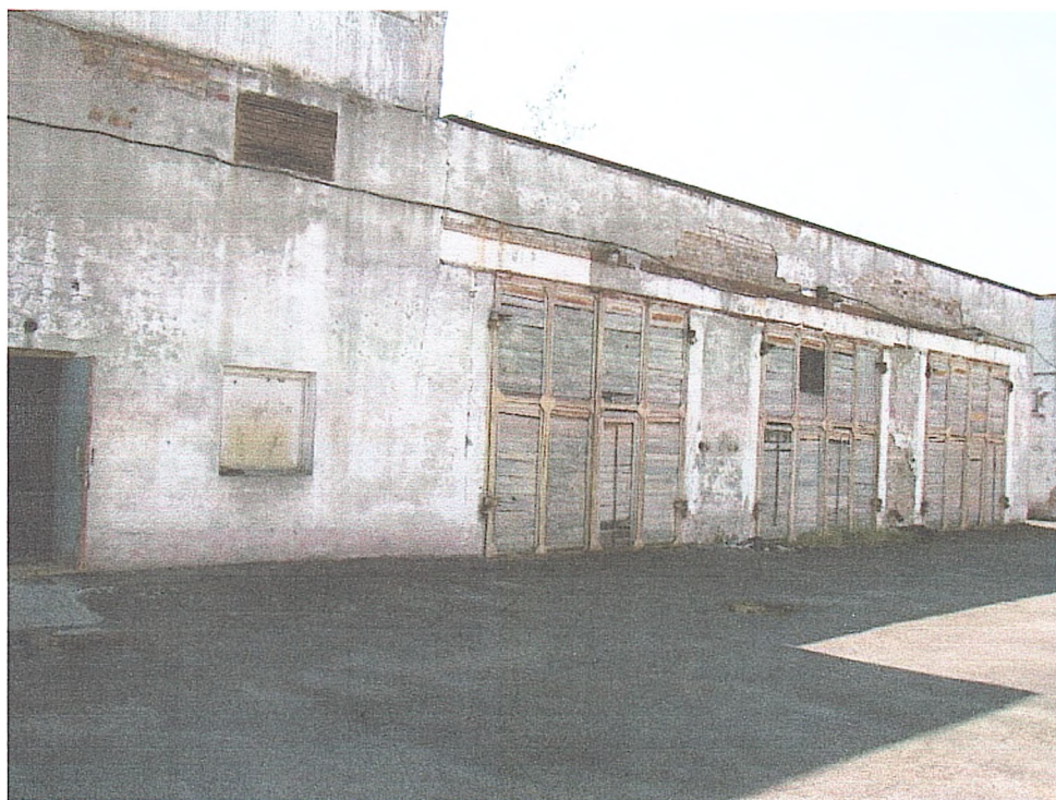
Фото № 4. Вигляд головного фасаду споруди гаража.