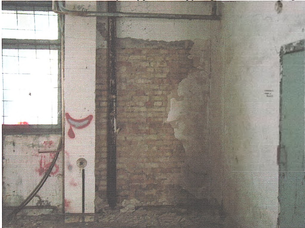
Фото № 12. Вигляд майстерні гаража.