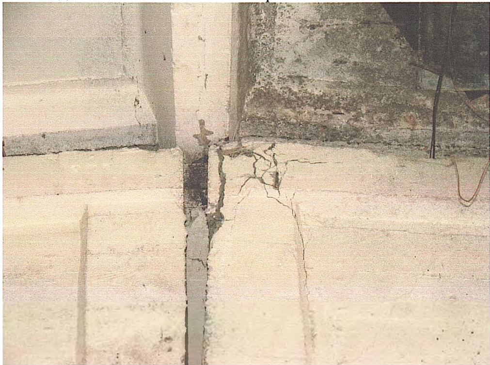
Фото № 6. Розкриття тріщин на опорних ділянках залізобетонних балок каркасу.