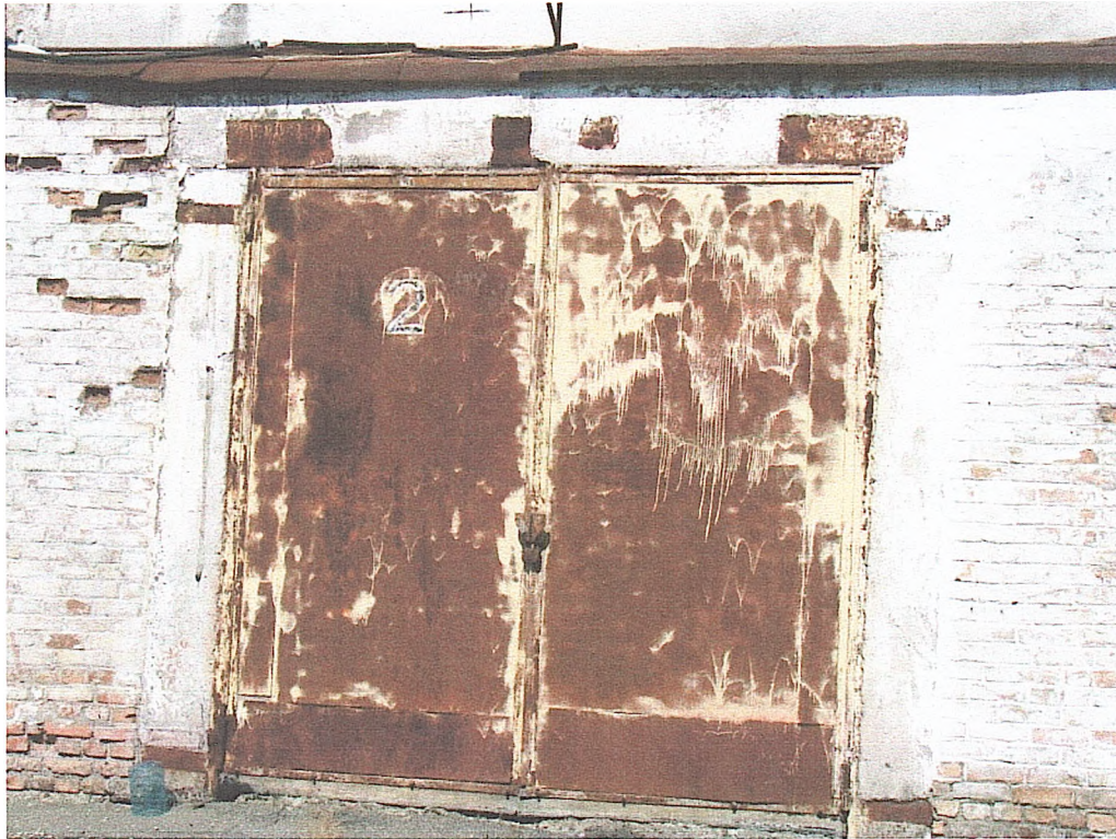
Фото № 7. Пошкоджені ділянки цегляного мурування стін (склад № 3).