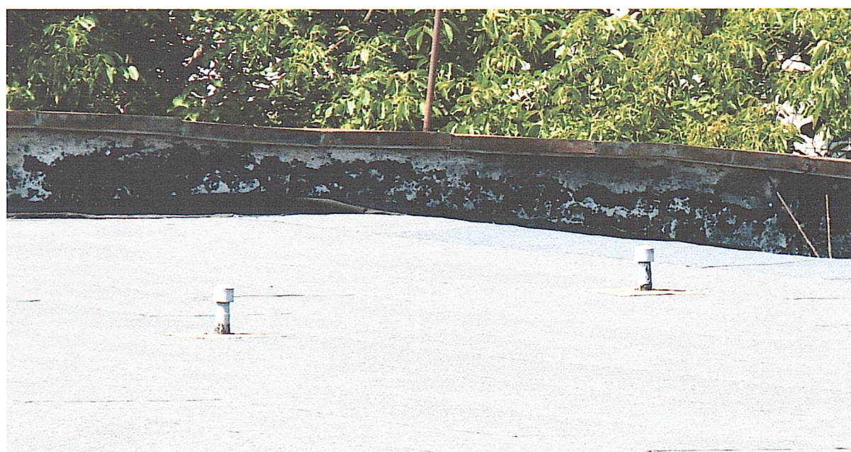
Фото № 18. Неякісно влаштоване прилягання рулонного килима до вертикальних поверхонь парапету (склад № 2).