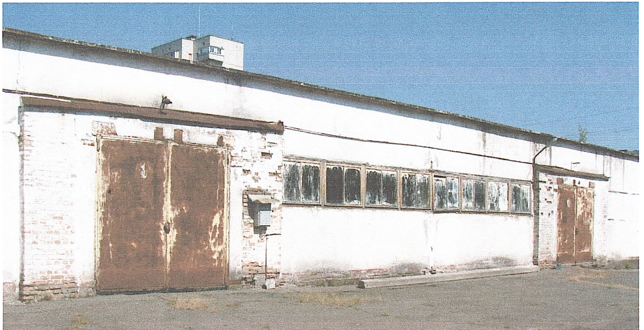
Фото № 2. Вигляд головного фасаду споруди складу № 3.