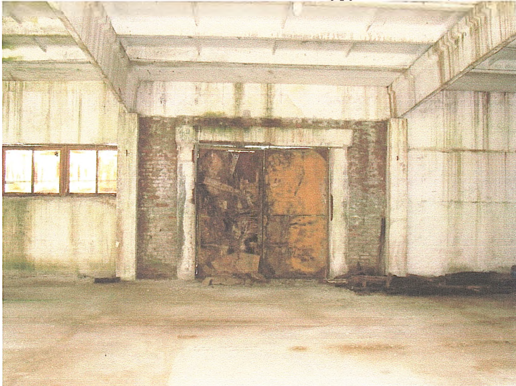
Фото № 8. Зволоження огорожувальних конструкцій. Дерев'яні дошки обшивки вражені гнилизною (склад № 3).