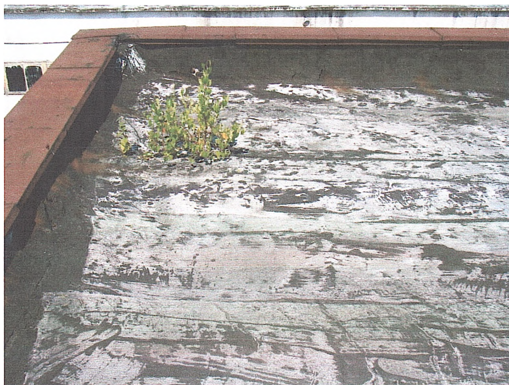
Фото № 20. Вигляд покрівлі споруди гаража (висока секція).