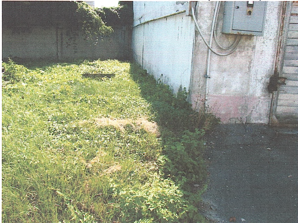
Фото № 10. Відсутнє вимощення біля гаража.