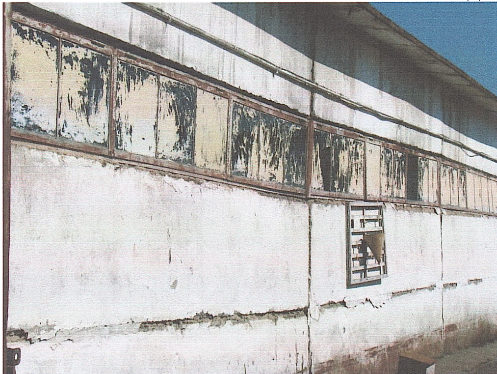
Фото № 5. Просадка однієї із колон. Перекос навісних стінових панелей. Пошкоджені віконні блоки. Вивітрені стики стінових панелей.